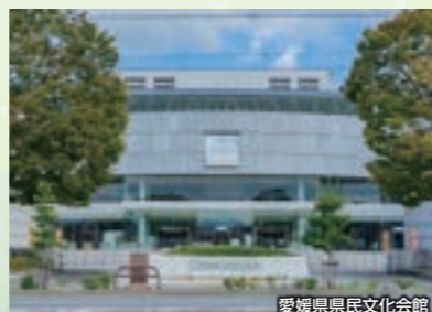
愛媛県県民文化会館

学会 愛媛県県民文化会館 地域医療交流会 愛媛県県民文化会館(真珠の間) 〒790-0843 松山市道後町2丁目5-1 TEL(089)923-5111